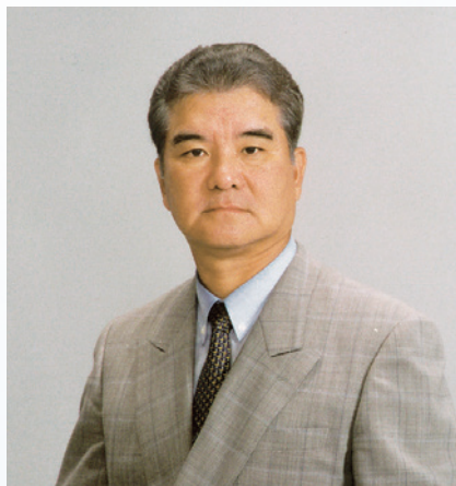
代表取締役会長兼社長 Executive chairman and President